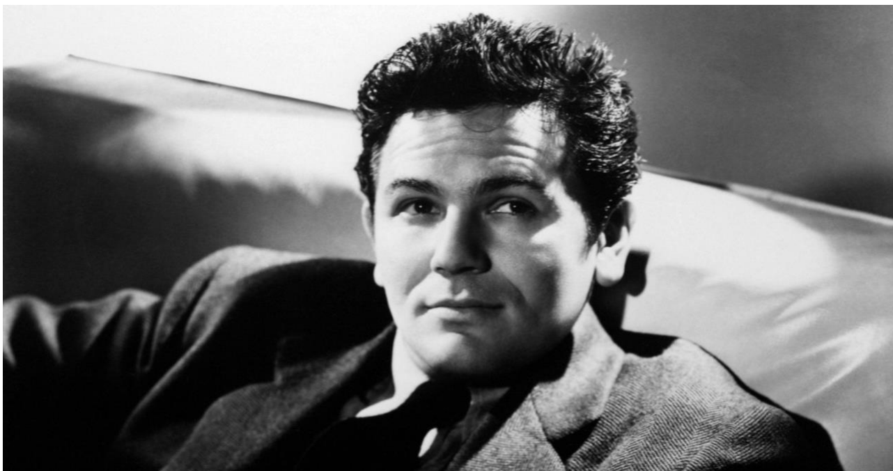
John Garfield