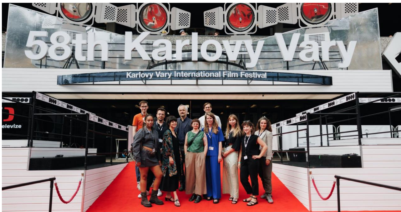
Ložští účastníci Future Frames, Photo Credit: Film Servis Festival Karlovy Vary

Program Future Frames – Generation NEXT of European Cinema, organizovaný MFF Karlovy Vary a European Film Promotion, již od roku 2015 pomáhá talentovaným evropským režisérům nastartovat jejich kariéru ve filmovém průmyslu. Již třetím rokem program rozšiřuje své příležitosti díky partnerství se společností Allwyn, zaměřenou na loterie a zábavu, a díky spolupráci s americkou talentovou agenturou UTA a společností Range Media Partners, které mladým filmařům poskytují cenné odborné vedení a možnost navázat klíčové kontakty.