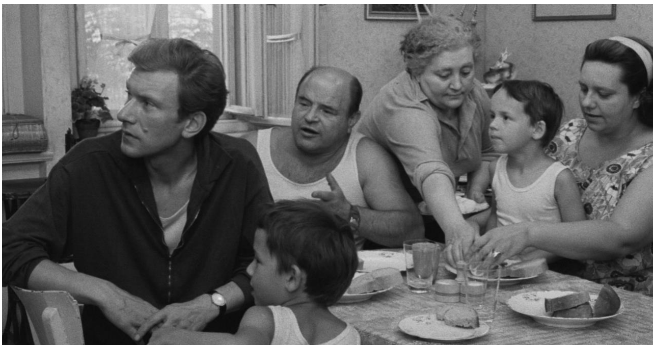
Ecce homo Homolka

Dlouholetá tradice premiérového uvádění digitálně restaurovaných filmů české a československé kinematografie pokračuje v rámci 59. ročníku MFF KV slavnostní projekcí filmu scenáristy a režiséra Jaroslava Papouška Ecce homo Homolka .